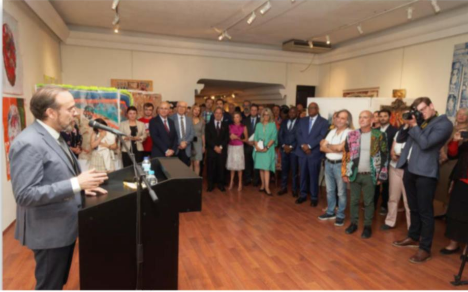
Resim.C.4. İletişim ve Tasarımı (Diğer) Sergisi