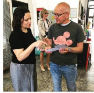
Resim.C.3. Grafik Tasarımı (Diğer) Sergisi