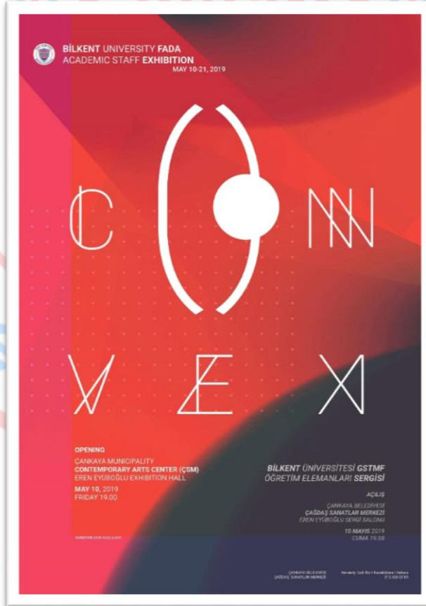
Resim.B.1. Güzel Sanatlar Bölümü Karma Sergisi

Bu etkinlik ve sergilere örnek olarak Güzel Sanatlar ve İletişim ve Tasarımı bölümlerinin etkinlik afişleri aşağıdaki gibidir;