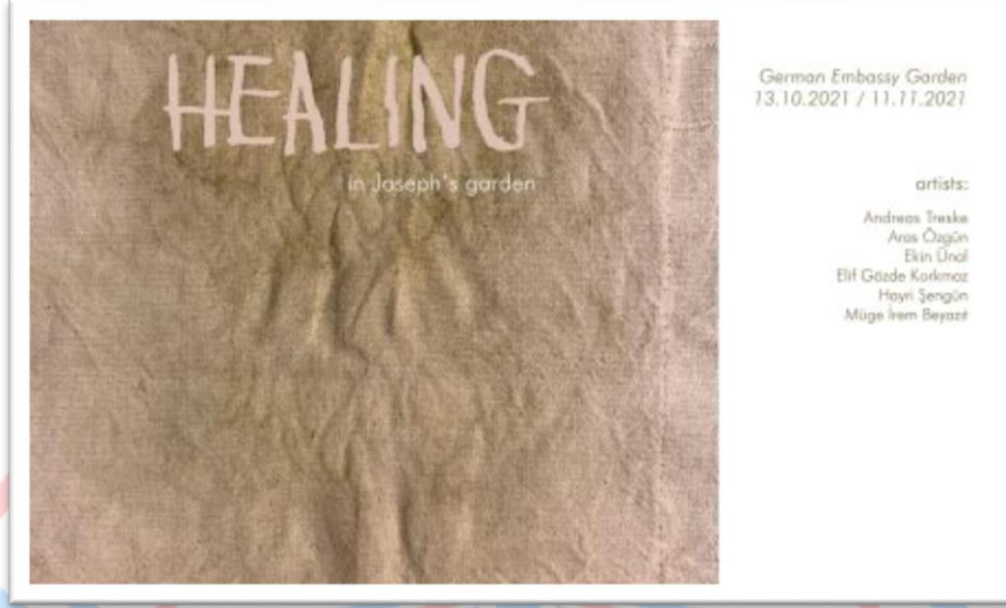
Resim.B.2. İletişim ve Tasarımı Bölümü Karma Sergisi