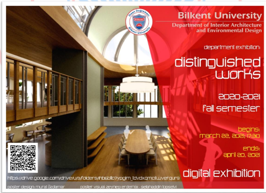
Resim.A.2. İç Mimarlık Çevre Tasarımı Bölümü Ders Sergisi