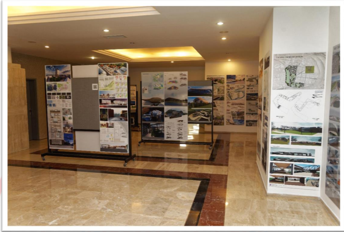
Resim.A.1. Mimarlık Bölümü Ders Sergisi