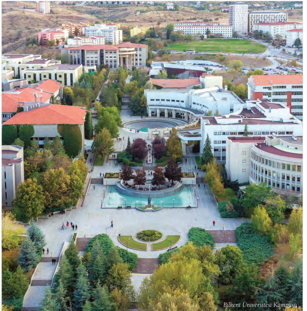
Bilkent Üniversitesi Kampüsü